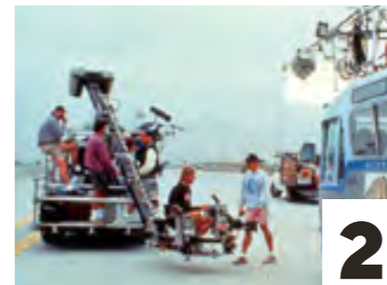
2. Een productieteam achter de schermen