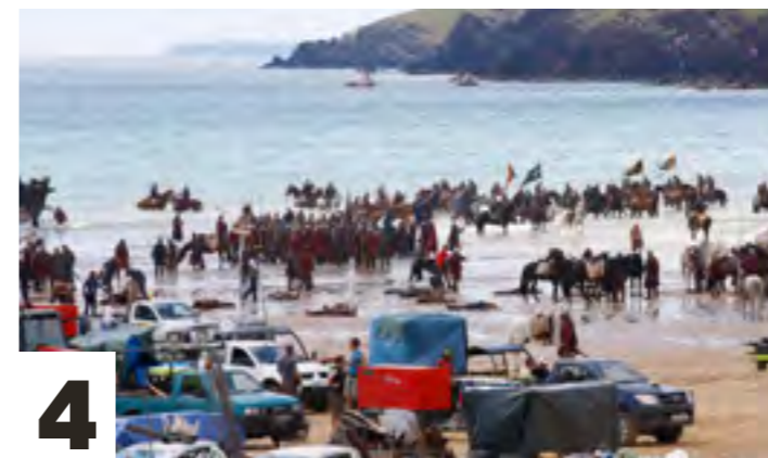
4. Robin Hood op locatie in Wales