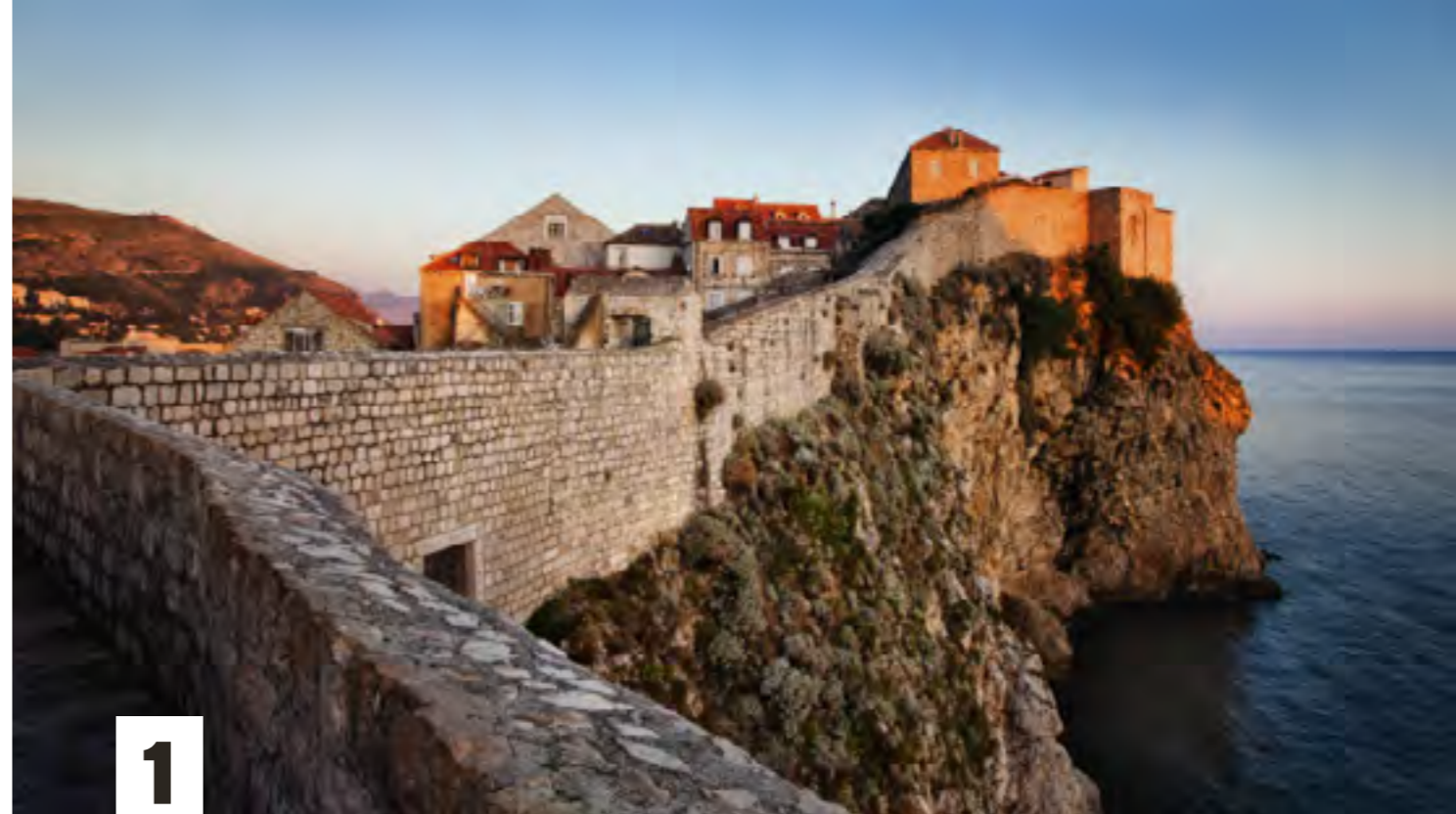
1. Dubrovnik, een belangrijke filmlocatie voor Game of Thrones

Sommige plaatsen in dit boek zijn al lang een toeristische trekpleister, maar andere liggen ver buiten de gebaande paden. En zelfs als je zelf niet het klamme oerwoud van Mexico in kunt gaan op zoek naar de Predator, of net als Frodo en zijn reisgenoten rond kunt trekken in de bergen van Nieuw-Zeeland, dan nog kun je nog steeds reizen in dit boek. Je weet nooit waar je uiteindelijk zult belanden.