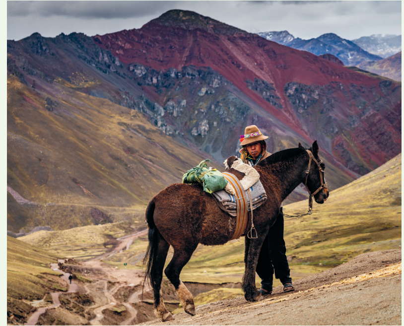
Op de Regenboogberg, die lange tijd onder een deken van ijs en sneeuw rustte

Voor Cusco en omgeving moet je de tijd nemen. 'Snelle' reizigers werken de stad en zijn omgeving in twee tot drie dagen af. Daarmee kun je weliswaar zeggen dat je er geweest