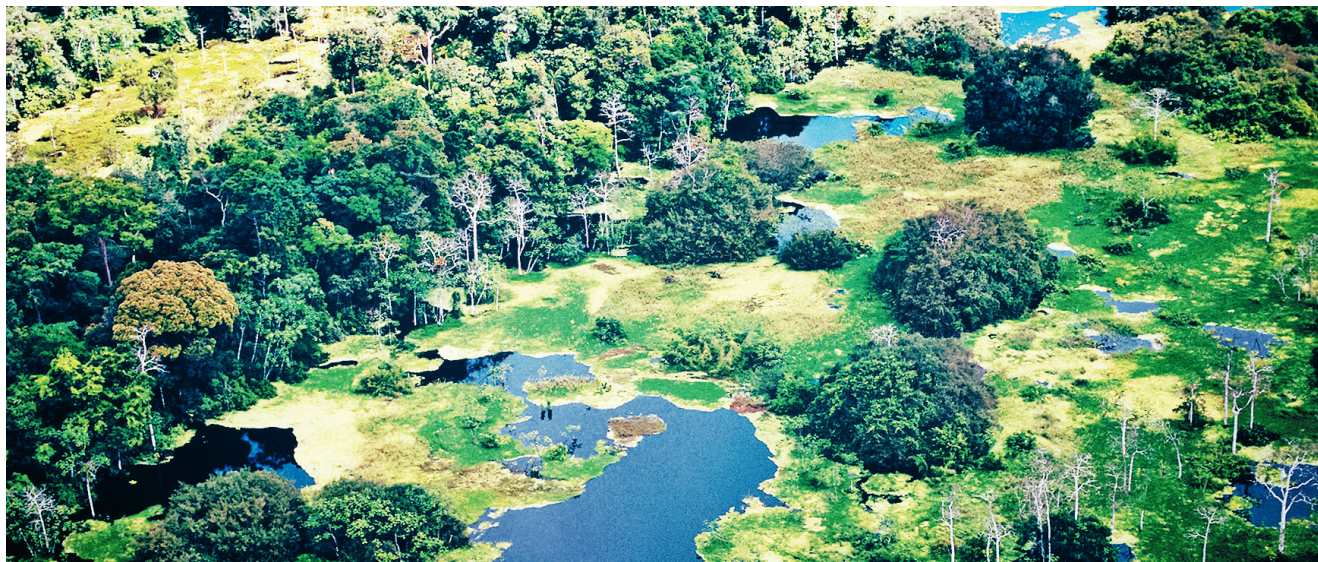
Wijdvertakt en adembenemend stroomt de Amazone door het oerwoud

Het aantal particuliere natuurparken is erg klein. Het eerste particuliere natuurgebied van Peru is het ecologische reservaat Chaparrí, 95 km ten zuidoosten van de stad Chiclayo. In de droge bossen van het reservaat leven