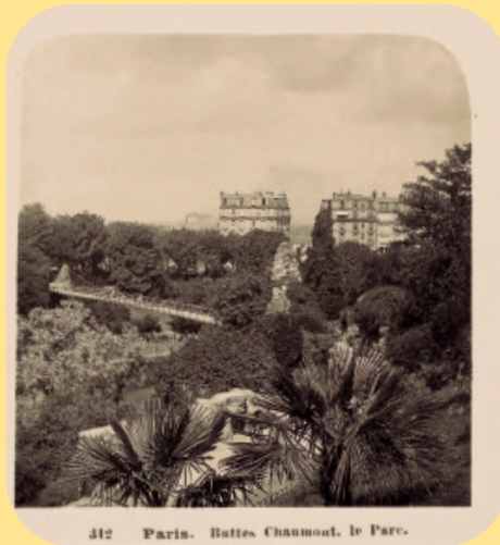
312 Paris. Buttes-Chaumont, le Parc.