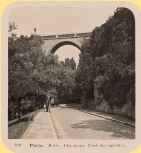
318 Paris. Buttes-Chaumont, Pont des saules.