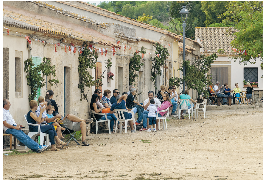
Op de grote dag van de 'curridoris' is iedereen erbij. In veel families geldt het dragen van het beeld van de Verlosser als een grote eer. Vaders geven deze taak graag door aan hun zonen