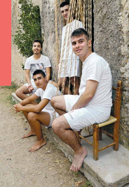
De loop duurt ongeveer een uur. Dan staat het beeld weer veilig in de kerk van San Salvatore en kunnen de lopers ontspannen