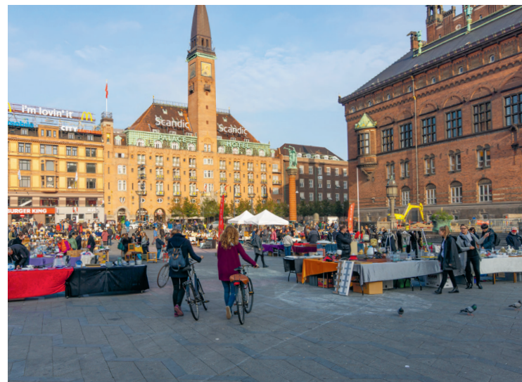
Markt op de Rådhuspladsen

Hop geeft toegang tot ruim veertig attracties in het centrum van de stad en gratis toegang tot de Hop On-Hop Off-bussen van Stromma die drie routes door Kopenhagen rijden. Hij is 24, 48 of 72 uur geldig en kost DKK575 (315) tot DKK950 (515). Prijzen voor kinderen van 12 tot 15 jaar (Junior) tussen haakjes, voor kinderen van 3 tot 11 jaar moet wel een gratis kaart (Kid) worden besteld in de app. Kijk op copenhagencard.com .