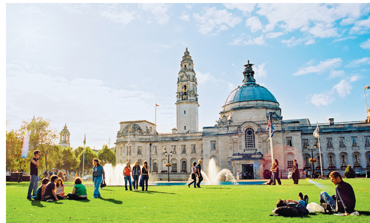
Een pauze in het park: de groene ruimte bij het Cardiff Civic Centre is bij mooi weer een plek om te chillen en niet alleen voor studenten van de nabijgelegen universiteit

Het eigenlijke stadscentrum tussen Cardiff Castle en de Shopping Arcades is slechts één kant van Cardiff. Het Civic Centre, een uitgestrekte prestigieuze wijk met universiteit, musea en bestuursgebouwen, en de aangrenzende universiteitswijk Cathays en de uitgestrekte parken tonen een andere kant. Dan zijn er nog de artistieke en intellectuele wijken Canton en Pontcanna en de dorpsstraten van Llandaff met zijn kathedraal ten westen van de rivier de Taff.