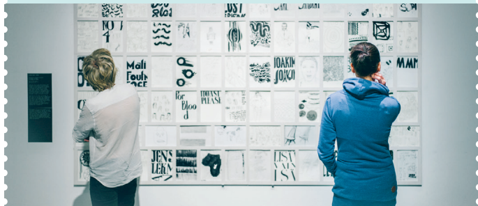
De expositie Don't shoot the messenger in het Designmuseum

Een museumbezoek in Helsinki is niet goedkoop, maar verschillende musea zijn gratis, zoals het Stedelijk Museum (► blz. 78) en zijn dependances – onder andere het Trammuseum (M E 2/3, trammuseum.fi ) en het Museum van Sociale Woningbouw (M G 2, workerhousingmuseum.fi ) – en verder het Arabia Design Centre (► blz. 103), het Bank van Finland Museum (M kaart 2, H 5, rahamuseo.fi ) en het Krantenmuseum (M kaart 2, G 5, paivalehdenmuseo.fi ). De andere locaties zijn vaak op een bepaalde dag of tijdstip gratis toegankelijk. Zo kun je op de eerste vrijdag van de maand gratis naar het Kiasma (► blz. 37), op de laatste dinsdag van de maand gratis naar het Architectuurmuseum (► blz. 81) en op vrijdag tussen 16 tot 18 uur gratis naar het Nationaal Museum (► blz. 39). Met de Helsinki Card ( helsinkiocard.com , ► blz. 110) bespaar je bij veel musea op de entreprijs.