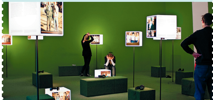
Ongelofelijk wat je met licht, fotografie en video kunt doen

Gratis toegang op 1e zondag van de maand: museums Sonntag.berlin .