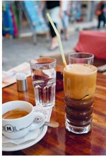
Espresso of frappé? Veel Grieken geven de voorkeur aan de koude, opgeklopte nescafé met ijs, want dat is verfrissend en verkoelend

veranderden de muziekkeuze en zetten meer barkrukken voor en achter de toonbank. Met deze ingrepen hebben ze voorkomen dat Brettós in de zoveelste souvenirwinkel veranderde en hebben ze een stukje van het oude Athene weten te redden door enkele concessies aan de moderne smaak te doen.