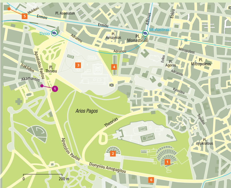
Uitneembare kaart: A–D 5–8 | Metro Akropoli (lijn 2), Monastiráki (lijn 1 en 3)

Wat er al niet te vinden is als je in oud puin graaft... Het Agorámuseum stelt ook alledaagse gebruiksvoorwerpen van toen tentoon. Bijvoorbeeld twee kleine, 2800 jaar oude terracotta laarzen (vitrine 20) en een slim bedachte po voor kinderen uit het begin van de 6e eeuw v.Chr. (vitrine 26). Je vindt er ook keukenspullen: een aardewerken grill (vitrine 42), grillspiesje en een draagbaar oventje (beide vitrine 60) uit de 6e-4e eeuw v.Chr.