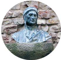
Het borstbeeld van Dante geeft aan waar zijn geboortehuis misschien heeft gestaan

In de Santa Margherita de' Cerchi 7 trouwde Dante rond 1285 met Gemma di Manetto. In deze kleine kerk vind je ook het familiegraf van de Portinari's, met een gedenkplaat voor de al jong gestorven Beatrice. In 1302 werd de vrijdenkende dichter-filosoof Dante in zijn geboortestad ter dood veroordeeld. De laatste jaren van zijn leven bracht Dante in ballingschap door en hij stierf in 1321 in de stad Ravenna aan de kust van de Adriatische Zee.