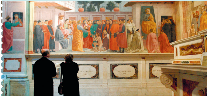
Florence is een paradijs voor fans van kleurrijke renaissancefresco's

Sluitingsdag: op maandag zijn de musea meestal gesloten, sommige sluiten ook op zondag hun deuren. Check altijd van tevoren!