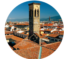
De toren van de Santa Trinità steekt hoog boven de huizenzee uit

Piazza Santa Trinità, ma.-za. 8-12, 16-18, zo. 8.15-10.45, 16-18 uur