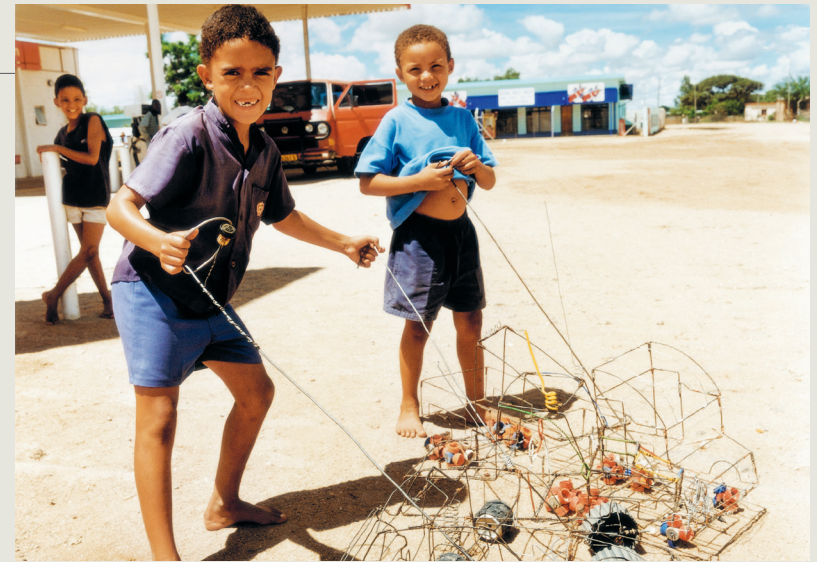
Kinderen in Rehoboth met hun zelfgemaakte auto's van ijzerdraad

Tijdens de Eerste Wereldoorlog weigerden de Basters aan Duitse zijde tegen de Zuid-Afrikanen te vechten. Ze wilden niet in de blanke oorlog betrokken worden. Daarop verklaarden de Duitsers hun in maart 1915 zelf de oorlog. De strijd eindigde al op 8 mei van datzelfde jaar, toen de Duitsers door de Zuid-Afrikaanse troepen werden teruggedrongen.