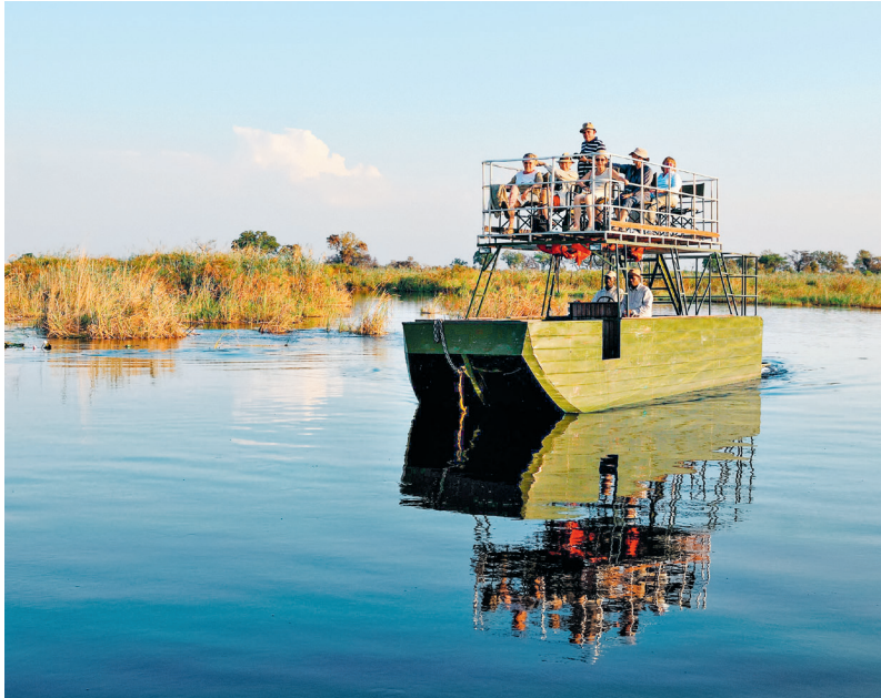
Cicadegezing begeleidt de boottocht op de Kwando Rivier

eenkomst tussen het ministerie voor Milieu en Toerisme en de lokale gemeenschappen die in de onmiddellijke nabijheid van een natuurreservaat leven, waarbij de laatste voor het onderhoud van de parken zorgen door er als rangers te werken en zo ook iets aan het natuurreservaat te verdienen. Voor het eerst in de Namibische geschiedenis kregen lokale gemeenschappen van jagers toestemming om zelf een kampeerterrein in een nationaal park in te richten en te beheren. De inheemse gemeenschappen zijn verantwoordelijk voor de wildbescherming in de gebieden die aan het nationaal park grenzen. De locals zorgen ervoor dat de inkomsten uit het kampeerterrein voor de natuurbescherming en de verbetering van de leefomstandigheden van de deelnemende gemeenschappen worden gebruikt.