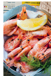
Groenlandse garnalen gaan ongepeld over de toonbank in de Östermalms saluhall, maar je kunt er ook terecht voor kant-en-klare salades en andere lekkernijen

Zien en gezien worden – het gebeurt vanzelf als je gaat shoppen in de Sturegallerian 3 (Grev Turegatan 9A, hoofdingang aan het Stureplan). Mensen kijken kan ook vanaf de vele cafeterrasen onder het dak van het exclusieve winkelcentrum. Rond de na een brand in 1997 in oude stijl herbouwde spa van Sturebadet 4 (► blz. 42) ligt een passage waar je kunt kiezen uit ongeveer vijftig restaurants en winkels, gevuld met een ruime keuze aan fraai vormgegeven papierwaren, sieraden en exclusieve mode. En natuurlijk boeken... Boekwinkel Hedengrens Bokhandel is een instituut in Stockholm.