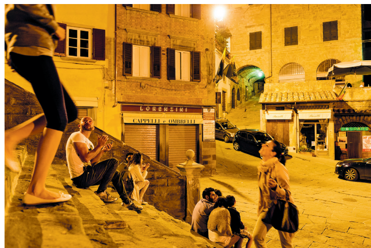
Ook 's avonds is de buitentrap van het stadhuis een geliefd trefpunt in het oude centrum van Cortona

Als je in dezelfde richting verder wandelt, kom je uit op de Piazza del Duomo , die uitmondt in een terras met uitzicht. Links ligt het kleine, maar interessante Museo Diocesano (Piazza del Duomo 1, apr.-okt. dag. 10.30-18.30, nov.-mrt. vr.-zo. 10-17 uur, €6). Hier zijn meesterwerken van Toscaanse schilders te zien, bijvoorbeeld van Fra Angelico