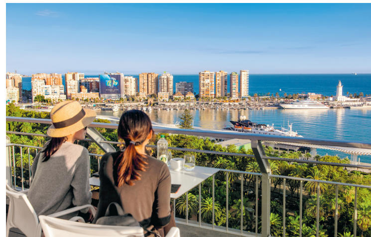
Een panorama tot aan de horizon. Vanaf het kasteel van Málaga of een bar op het dak in de buurt van de haven is het uitzicht geweldig

In de oude stad, die voetgangersvriendelijk is gemaakt, zie je de pracht van de Malagueñische fin-de-siècle-architectuur.