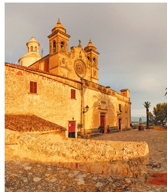
Bij een laagstaande avondzon lijkt de Ermita de Bonany te gloeien dankzij de okertinten van de stenen

... zo noemen de locals deze bedevaartskerk, die officieel Ermita de Bonany (🏡 G 5) heet. Door de ligging op de top van een beboste berg is de kerk al van verre zichtbaar. Hier wordt een Mariabeeld vereerd dat in 1609 een einde gemaakt zou hebben aan een dreigende droogte. De akkers waren dor, de oogst leek te mislukken. Nadat de inwoners in processie naar