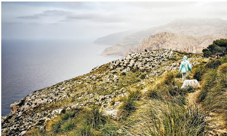
De wandeling van Sant Elm naar La Trapa doorkruist een kustlandschap met kale rotsen en hier en daar een struik