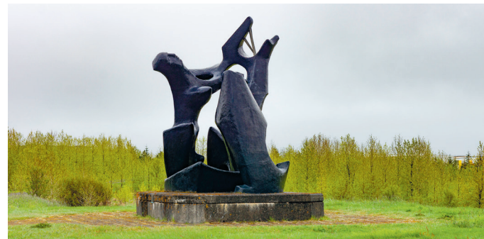
Sonatorrek, een beeld van Ásmundur Sveinsson geïnspireerd door het gelijknamige gedicht van Egill Skallagrímsson bij de kerk van Borg, niet ver van Borgarnes

Aan de Brákarsund bij Borgarnes staat op een mooie plek een monument ter nagedachtenis aan Þorgerður Brák, die door Skalla-Grímur, de vader van Egill Skallagrímsson, hier de dood werd in gedreven. Er staat ook een van de negen steenmannen die verwijzen naar Egils saga Skallagrímsonar .