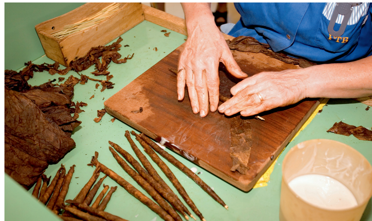
Van april tot oktober wordt er elke donderdag en vrijdag een rondleiding gegeven in de sigarenfabriek

Eeuwenlang nam dit grensdorp (2000 inwoners) een speciale positie in het machtspeel tussen diverse heersers in. Vanaf de middeleeuwen tot 1798 behield dit gebied zijn speciale rechten als onafhankelijke republiek. Tot de weg langs het meer werd aangelegd, was de plaats eigenlijk alleen met de boot te bereiken. Het laagste deel van de drie heuvelruggen ( coste ) is flink bebouwd, omdat veel buitenlanders werden aangetrokken door de beschutte ligging – de Monte Gridone houdt de koude wind tegen. Maar als je iets verder omhoog loopt, bijvoorbeeld over de trap treden van de Sacro Monte, beland je al gauw in een mooi landschap met tal van wandelroutes, zoals die naar het Bosco Sacro, ofwel 'Heilig Bos', waar in juni een gele bloemenpracht te bewonderen valt. Brissago werd beroemd door de eilanden (► blz. 42), en door de handgemaakte Brissagosigaren