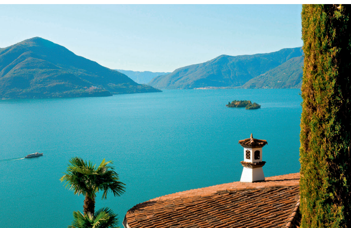
Vanuit Ronco kijk je uit op juweeltjes in het meer, de bijzondere Brissago-eilanden

De Italiaanse componist Ruggero Leoncavallo heeft een paar jaar in Brissago gewoond en ligt hier ook begraven. Foto's, partituren en de reconstructie van zijn werkkamer zijn te bewonderen in het Palazzo Branca-Baccalà (leoncavallo.ch, half mrt.-okt., wo.-za. 10-12, 16-18 uur, volwassenen CHF5, korting CHF3).