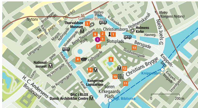
Uitneembare kaart kaart 2, G 6 | Bus Christiansborg | Havnebus Kgl. Bibliotek

Zoveel macht onder één dak moet worden beschermd: stalen bolvers blokkeren de vrije doorgang naar koningin, premier, parlement en hoogste gerecht