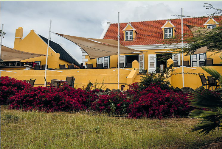
Klein Santa Martha

Uitneembare kaart: 2 A 1-5/B 1-5/C 3-5D 4-5