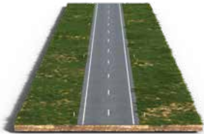
Een gewone onderbroken streep.

De waarschuwingstreep is een speciale markering op de weg. Deze streep heeft lange strepen en korte onderbrekingen. De waarschuwingstreep waarschuwt je, bijvoorbeeld voor een gevaarlijke bocht of onoverzichtelijke situatie. Meestal volgt na de waarschuwingstreep een doorgetrokken streep.