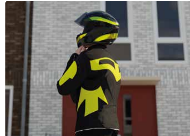
Draag reflecterende of opvallende kleding om je zichtbaarheid te verbeteren.

Kleding beschermt het lichaam bij een val tegen letsel. Stap dan ook nooit op de motorfiets zonder je motorkleding. Kies hierbij voor kleding die ook je benen en armen volledig bedekt. Motorkleding mag uit één pak of uit twee delen bestaan. Veelgebruikte materialen zijn leer, textiel en kunststof. Belangrijk is dat de kleding je beschermt bij een valpartij en tijdens het rijden beschermt tegen water en kou.