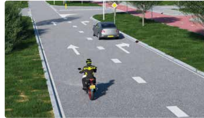
Je mag hier over de blokmarkering rijden om voor te sorteren naar rechts.

Blokmarkering is een brede onderbroken streep die je mag overschrijden. Blokmarkering geeft invoeg-, uitrijstroken of splitsingen in wegen aan. Ook voorsorteerstroken worden soms met blokmarkering aangegeven.