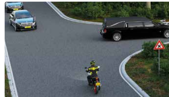
Een militaire colonne of uitvaartstoet mag je niet doorsnijden.

Deze stoet bestaat uit een rouwauto en volgauto's. Zij begeleiden een overledene of de as van een overledene naar de laatste rustplaats. Een uitvaartstoet -of rouwstoet- herken je aan het herkenningsteken.