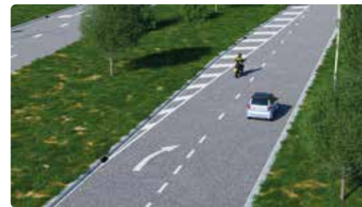
Op het verdrijvingsvlak mag je niet rijden. De pijlen wijzen naar de kant van de rijbaan waar je moet gaan rijden.

Sommige markeringsvlakken verbieden je een bepaald deel van de weg te gebruiken. Dit zijn het verdrijvingsvlak en het puntstuk.