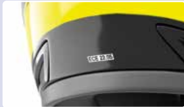
Een goedgekeurde helm herken je aan de markering: ECE22-05.

Bestuurders van een motorfiets en eventuele passagiers moeten een passende helm met een wettelijk goedkeuringsmerk dragen. De helm moet goed aansluiten op het hoofd, zonder te knellen. De kinband moet zo aangetrokken zijn, dat de helm niet over de kin kan schuiven. De helm is bij voorkeur licht van kleur of voorzien van opvallende markeringen, zodat deze de drager beter zichtbaar maakt.