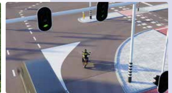
Ook op het puntstuk mag je niet rijden. Het puntstuk leidt het verkeer in de juiste richting.