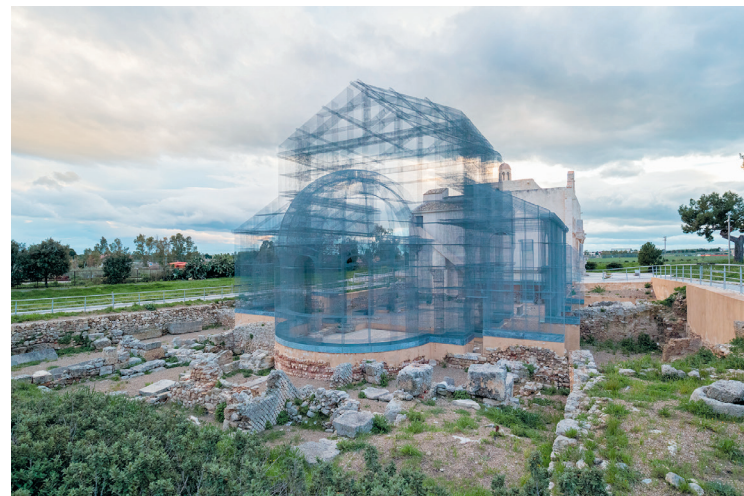
Oud ontmoet modern: de Santa Maria di Siponto

Het begon allemaal heel veelbelovend toen de Cassa per il Mezzogiorno besloot