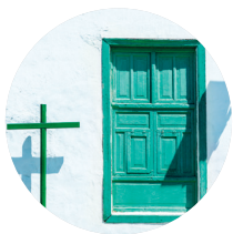
De kleuren van Lanzarote

Teguisse, door de Lanzaroteños simpelweg La Villa genoemd, is nog altijd een welvarende stad, ook al raakte het in 1852 zijn status als hoofdstad kwijt toen het economische centrum naar Arrecife werd verplaatst. De locatie van Teguisse in het midden van het eiland had als voordeel dat de regelmatig binnenvallende piraten de stad niet konden verrassen, temeer daar men in het nabijgelegen Castillo de Santa Bárbara (► blz. 44) wachtposten stationeerde. Niettemin bleef ook Teguisse niet van aanvallen verschoond. De Callejón de la Sangre 1 (Bloedsteeg) herinnert aan de twee zwaarste piratenaanvallen