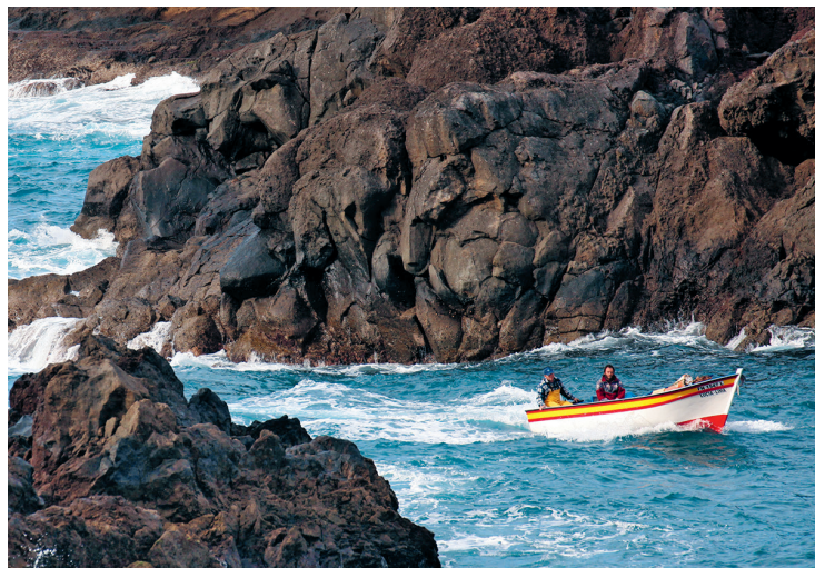
Het is niet ongevaarlijk voor het kleine vissersbootje om zo dicht langs de rotsen van de ruige kust van Porto Moniz te varen

Op een donkere, in zee stekende lavatong staan lichtgekleurde huizen. Voor het fraaiste uitzicht op het plaatsje moet je naar de Miradouro da Santinha aan de weg die vanaf Santa komt. Wie vanaf de noordkust richting Porto Moniz rijdt, komt door een lange tunnel, die een zenuwslopende weg langs de steile kust overbodig heeft gemaakt. De laatste is alleen in