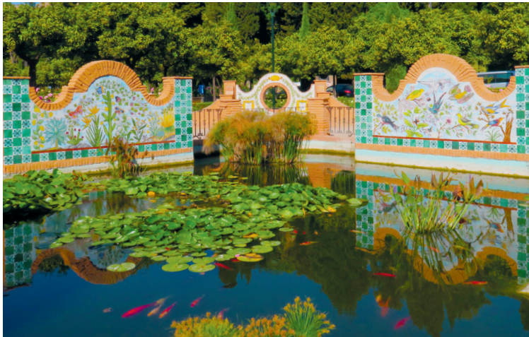
Vijver in de Jardines de Pedro Luis Alonso, naast het stadhuis

Calle Realenga de San Luis 11, parquedelouestemalaga.blogspot.nl, mei-half sept. dag. 7.30-0.30, half sept.-april dag. 7.45-22 uur