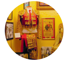
Stierenvechterskostuum in het Museo Taurino

Stierengevechten vonden oorspronkelijk plaats op bestaande pleinen, in Málaga gebeurde dat bijvoorbeeld op de Plaza de la Constitución. Later koos men voor permanente arena's. Verschillende, deels houten exemplaren zagen het licht voordat de huidige Plaza de Toros La Malagueta 4 er stond. Deze werd gebouwd tussen 1874 en 1876 volgens de ontwerpen van Joaquín Rucoba, de architect die ook de Mercado de Atarazanas voor zijn rekening