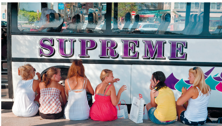
Shoppen kan prima in Sliema, al zijn deze jongedames er waarschijnlijk eigenlijk om Engels te leren