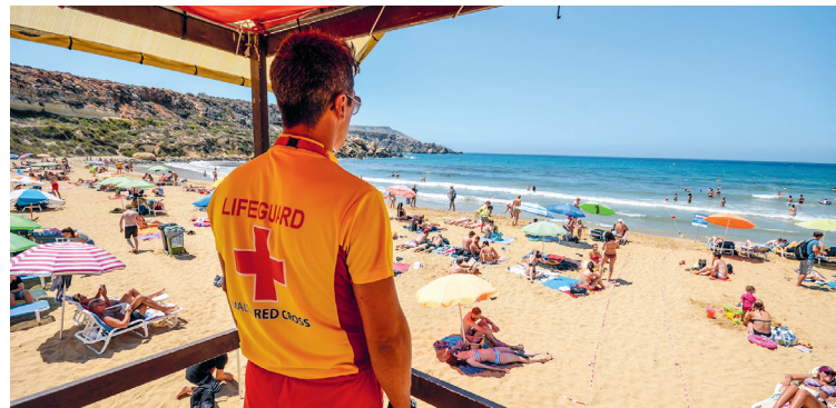
De zon bakt, de lifeguard let op en het zand schittert als goud. Daarom heet de baai ook Golden Bay en is het het beste strand van Malta

strandkiosk worden nu in een nieuw gebouw bij de parkeerplaats goedkope snacks voor strandgangers geserveerd. Zeer informeel – dresscode badkleding! Op de bovenverdieping met terras gaat het er gedistingeerder aan toe; van okt. tot mei zit hier een hippe eettaak met superuitzicht en Italiaanse keuken.