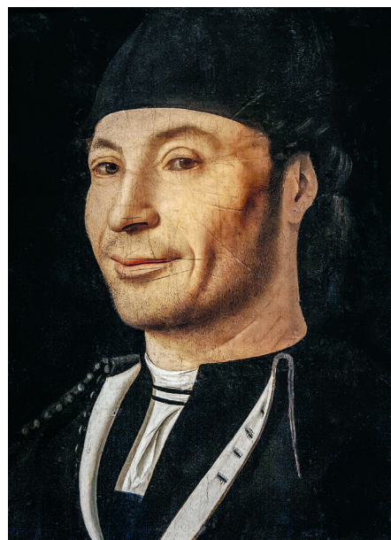
'Portret van een onbekende' van Antonello da Messina

Voor al de felle kleuren en het gebruik van licht waren indrukwekkend.