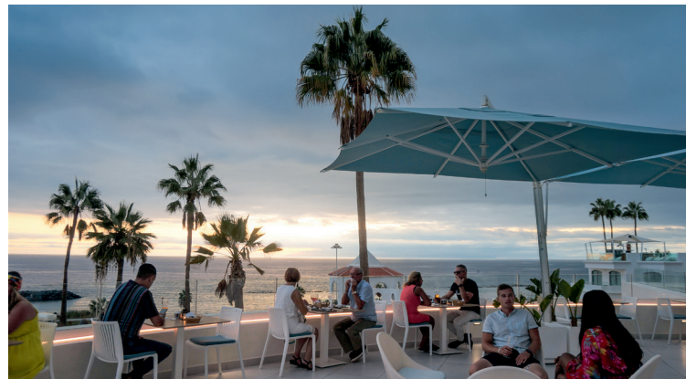
Bij zonsondergang is de Food Gourmet Market bij Iberostar Selection Sábila een geweldige plek! Geniet in een ontspannen sfeer met livemuziek van cocktails en heerlijke, versbereide tapas

Edif. Capitanía, Puerto Colón, tel. 922 71 42 11