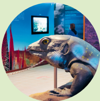
Model van een salamander in het bezoekerscentrum in El Portillo. Ten noordwesten van het centrum van La Orotava is een tweede bezoekerscentrum ingericht. Ook hier word je multimediaal geïnformeerd over de Teide en de Cañadas en kun je je ook aanmelden voor een excursie met gids (► blz. 103)