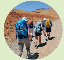
Goed uitgerust en in ganzenmars gaat het naar La Fortaleza, de 'rotsvesting'

Bij de volgende splitsing leidt route 25 (rechts) naar het Orotavadal en route 22 (links) naar de Montaña Blanca. Vervolg de route echter in westelijke richting, langs de voet van de ruige, torenhoge wanden van La Fortaleza 5 . De afgesplinterde brokken puimsteen en de grote rotsen geven het landschap een dramatisch tintje. Aan het einde van de Cañada de los Guancheros, waar het pad flink begint te dalen en langzaam tussen de rotsblokken verdwijnt, bereik je het keerpunt van de wandeling. Voordat je omkeert en via dezelfde route terugloopt, kunt je genieten van het prachtige uitzicht op de vulkaan de Teide. In de diepte onder je ligt het noordelijke deel van het eiland – een spectaculaire plek voor een picknick!