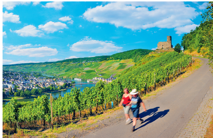
Wie vanuit Bernkastel-Kues te voet naar de burcht Landshut gaat, loopt door wijngaarden met uitzicht op de Moezel

Vanuit de kruidentuin , een paar minuten zwoegen tegen de steile helling op, heb je een mooi uitzicht op het dorpje (en bovendien een sensationeel uitzicht op de nieuwe Hochmoselbrücke – zie hiernaast). Hier kun je tijdens een wandeling op de Themenweg allerlei wetenswaardigheden opdoen over geneeskragtige en specerijplanten, en ook veel oude soorten bewonderen. De tuin is tot stand gekomen dankzij het wijnhuis Ürziger Würzgarten. Hier-vandaan kun je beneden een gebouw zien met een opvallende gevel: dat is de Mönchhof, die in de jaren 80 van de vorige eeuw als decor diende voor de Duitse serie Moselbrück . De serie was gewijd aan het leven op een wijnboerderij.