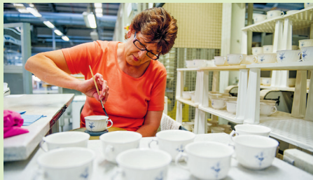
Het 'Vieux Luxemburg' is al bijna 250 jaar een goed lopende lijn en wordt altijd nog met de hand beschilderd

Eén servieslijn wordt zelfs al sinds 1770 geproduceerd: het door zijn fijne blauwe bloesemtakjes onmiskenbare 'Vieux Luxemburg'. De onderneming zelf is maar een paar decennia ouder. In 1748 stichtten ijzergieter François Boch en zijn drie zoons een keramiekmanufactuur in het Lotha-