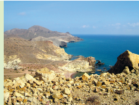
Cabo de Gata

Playa de Mónsul 3 is een waar droomstrand. Volkomen ongerept en overweldigend uitgestrekt ligt de baai tussen de kale rotsen. Aan het oostelijke eind ligt een opvallende versteende 'golf', La Peineta 4 genoemd. Dit is een overblijfsel van een lavatong die in de loop van de eeuwen door wind en water is geërodeerd. Het strand met fijn, donker zand wordt begrensd door rotsen van de