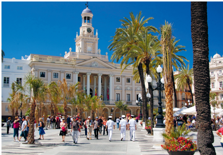
Cruise gasten en mariniers bevolken Plaza San Juan de Dios in Cádiz

Arcos de la Frontera (D 6). Dit ligt 30 km ten oosten van Jerez boven op een steile rots gedrapeerd. Rondom de oude kern is Arcos uitgegroeid tot een levendig stadje met 31.000 inwoners. Het oude centrum, dat lastig per auto bereikbaar is, telt veel stille straatjes en steegjes met een romantische sfeer. In de Moorse tijd gold Arcos als een onneembare vesting; niettemin viel het in 1264 in christenhanden.