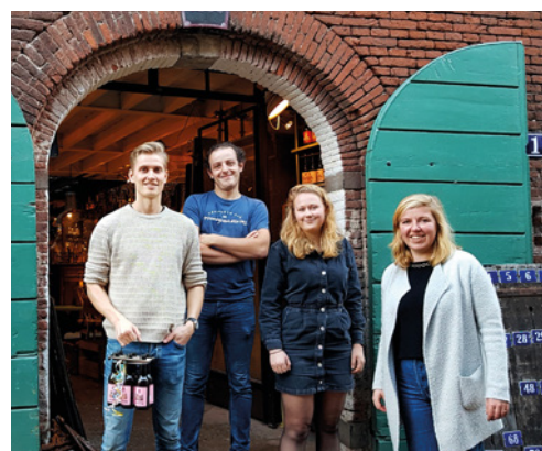
Bij de brouwerij