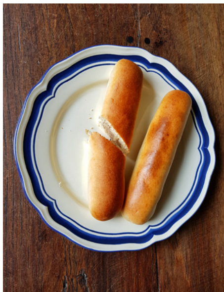
Twee Brabantse worstenbroodjes

Als er markt is op de Markt , op woensdag, vrijdag en zater-