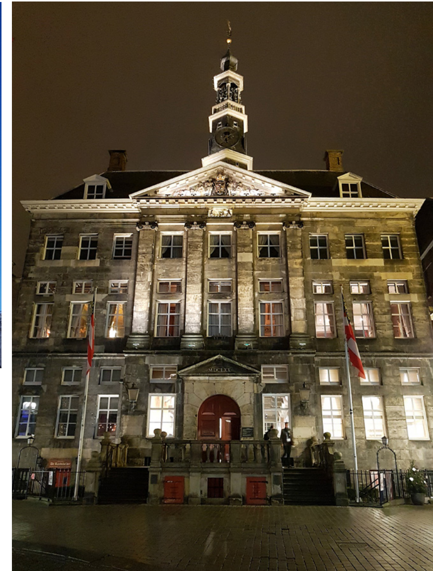
Het oude stadhuis op de Markt

hoek en het Anne Frankplein gaat de route naar links, de Waterstraat in. Sla aan het einde rechtsaf, de Verwersstraat in. Na minder dan 30 m is aan je rechterhand het plein voor de hoofdingang van het Noordbrabants Museum.