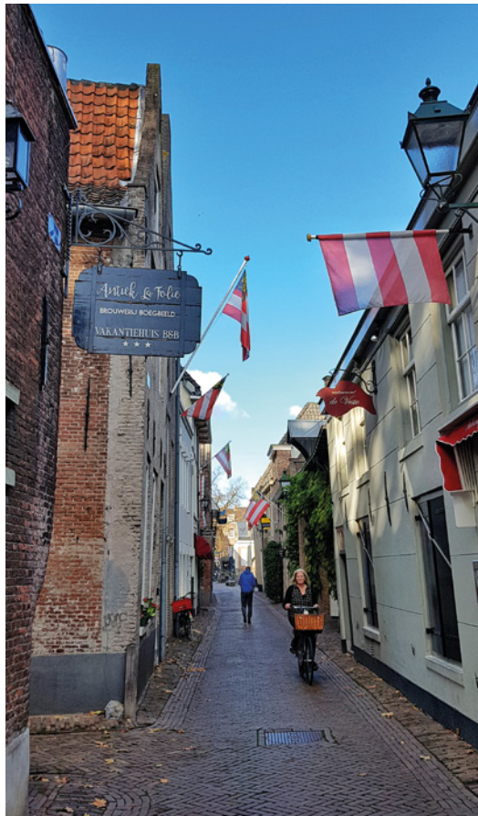
Blik in de Molenstraat