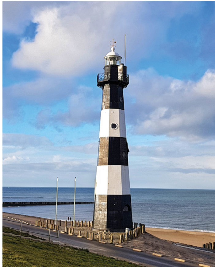
Vuurtoren Nieuwe Sluis