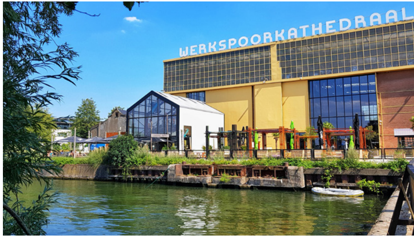
Werkspoorkathedraal en proeflokaal De Leckere