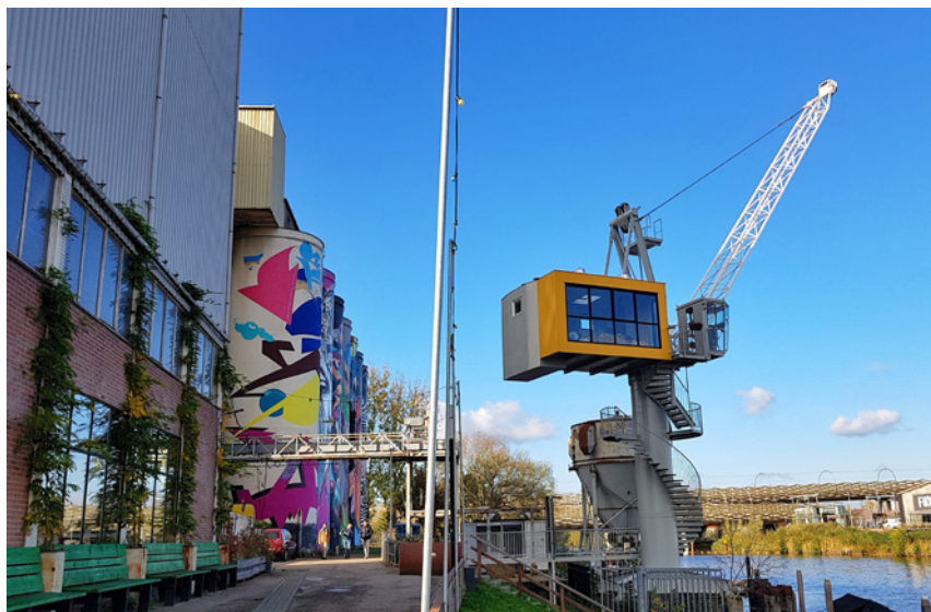
De Bossche Kraan, met unieke suite erin

Mengfabriek werd rond 1909 gebouwd en is een rijksmonument. Hier begon ooit een meelfabriek die na de oorlog van locatie ruilde met een mengvoederfabriek uit Rotterdam. In 1983 kwam de fabriek in bezit van De Heus Voeders, de eigenaar die in 2014 dus de lichten uitdeed. Onder regie van de gemeente Den Bosch is het complex vervolgens nieuw