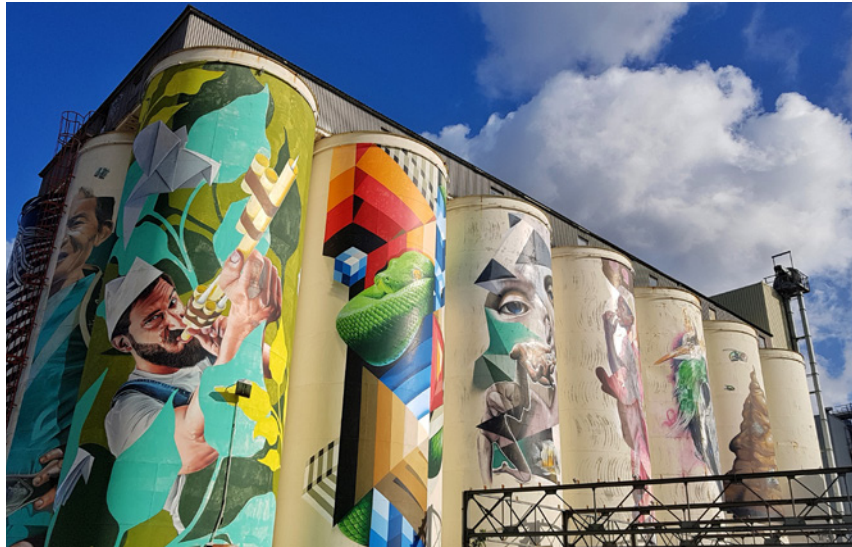
De oude mengvoedersilo's

te staan. De fabriek kreeg in 2004 een nieuwe bestemming als theatercomplex en telt nu twee theaterzalen, vijf filmzalen, een café-restaurant en repetitieruimten.