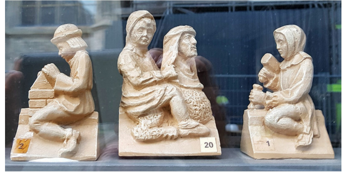
Replica's van beeldjes op de Sint-Jan

gebouw is ingericht als beeldtuin. Verder is de permanente presentatie De wereld van Bosch beslist de moeite waard, die inzicht biedt in de geheimzinnige beeldtaal van Jheronimus Bosch.