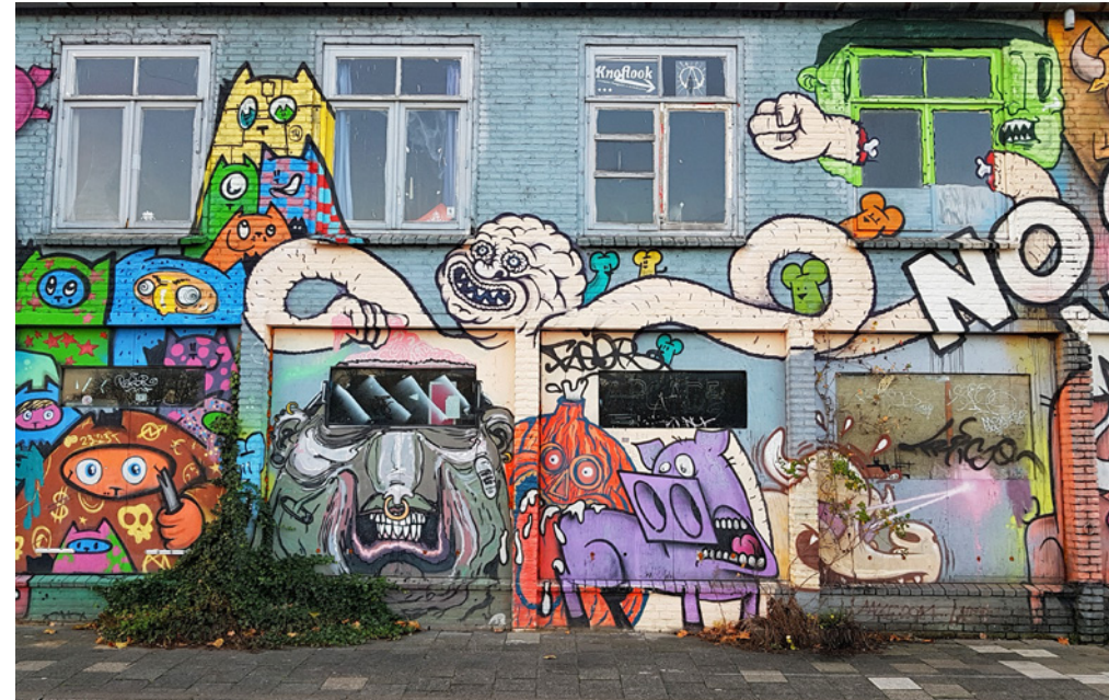
Kraakpanden langs de Havenkade

leven ingeblazen. In de Mengfabriek zit bijvoorbeeld een heel scala aan bedrijfjes en hippe horeca. In de gebouwen rechts ervan huizen onder meer een boksschool, een skate center en een breakdance en hiphop dansschool. Het Werkwarenhuis links daarvan is het creatieve centrum van het terrein en in de 2800 m 2 grote Kaaihallen nog verder naar links, vinden evenementen plaats ( www.mengfabriek.nl ).