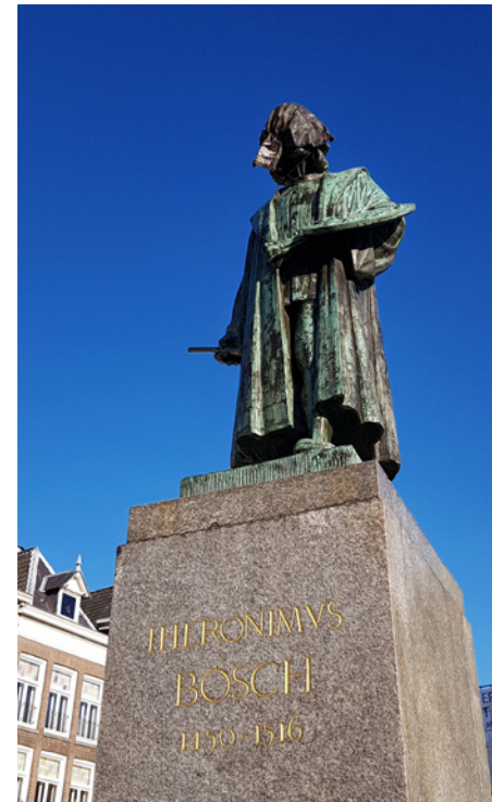
Standbeeld van Jheronimus Bosch

Ga schuin tegenover de antiekwinkel met brouwerij links het Uilenburgstraatje in. Sla aan het einde rechtsaf en loop de Postelstraat in. Na iets minder dan 100 m loop je links de Stoofstraat in. Sla aan het einde rechtsaf naar de Snellestraat, een deel van het voetgangersgebied in de binnenstad. Steek 30 m verderop dwarsstraat de Schapenmarkt over en vervolg je wandeling door het voetgangersgebied over de straat Achter het Vergulde Harnas, die na zo'n 40 m overgaat in Achter het Wild