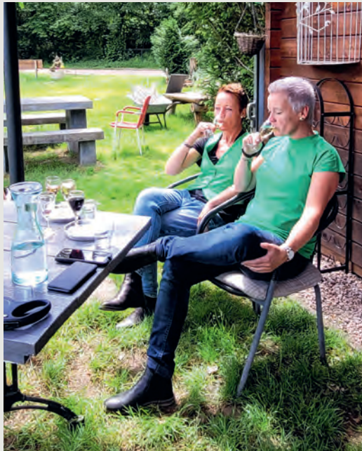
EEN PROEVE RIJ NA HET WANDELLEN