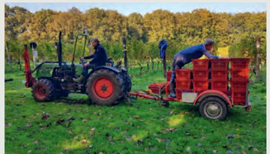
LANGS NEDERLANDSE WIJNGAARDEN EN WIJNMAKERS