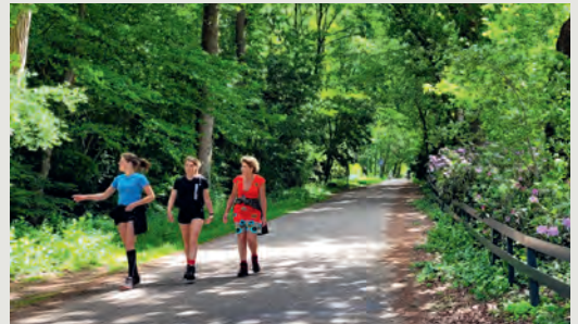
ROUTEBSCHRIJVINGEN MET OVERZICHTELIJK KAARTJE