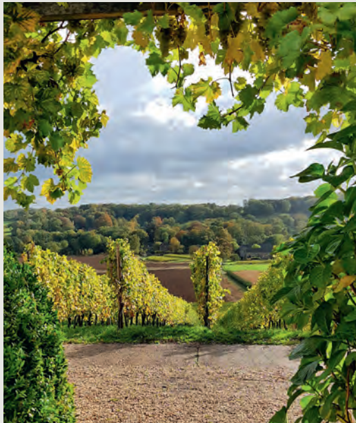
ADRESSEN WAAR JE GEWEEST MOET ZIJN