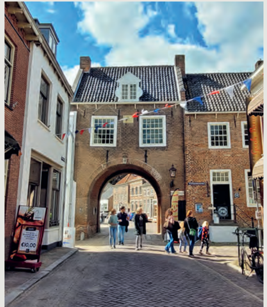
25 WANDELINGEN DOOR HET HELE LAND