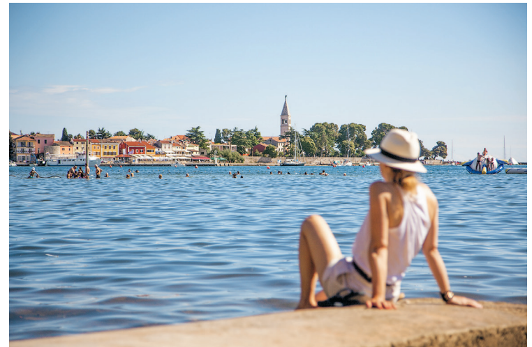
De oude stad van Novigrad ligt op een landtong.

Marinemuseum Gallerion: een museum gewijd aan de marine van de Donaumonarchie Oostenrijk-Hongarije, dat is niet direct iets wat je hier verwacht. Het museum in de oude stad bezit tal van scheepsmodellen. Het zwaartepunt ligt bij de 19e eeuw, toen de Habsburgers hun ogen op de Adriatische Zee richtten en tot een zeemacht wilden uitgroeien. Het