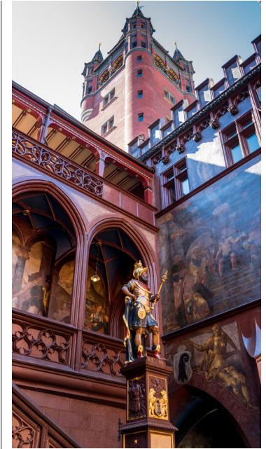
Het Rathaus van Basel is gebouwd in renaissancestijl, heeft gotische ornamenten, een prachtige klok en kleurige schilderingen

Basels historie gaat terug tot de 3e eeuw, toen de Romeinen langs de Rijn de legerplaats Basilia aanlegden. In de 4e eeuw werd Basel prijsgegeven aan de Alemanen die de Rijn overstaken. In de middeleeuwen vestigden de Franken zich op deze plaats en ontwikkelde Basel zich tot een zelfstandige stadstaat met een bisschop aan het hoofd. In 1501 trad Basel toe tot het Zwitserse Eedgenootschap. Kort daarna kreeg de Reformatie er een grote invloed, zozeer zelfs dat de bisschop en het domkapittel de stad verlieten: Basel werd een protestantse stad. Papierindustrie, drukkerijen en de zijde-industrie brachten in de 16e tot 18e eeuw grote welvaart. Met de bereiding van kleurstoffen voor de zijde-industrie werd de basis gelegd voor de grote chemische en farmaceutische concerns van tegenwoordig.