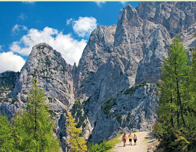
Een wereld van gneis en graniet – wandelen bij de Vrščipas.

Alleen al de rit omhoog naar de 1611 m hoge Vrščipas is een belevenis! Vanuit Kranjska Gora 1 kronkelt de omstreeks 1916 aangelegde alpenweg in 25 haarspeldbochten (stijgingspercentage 14 %) naar de pas, daarna gaat het langs even