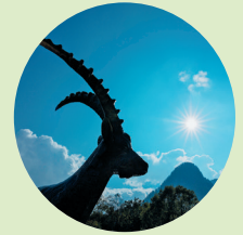
Zlatorog – 'Goudhoorn' aan het Jasnameer.

Wie zin heeft in een beetje avontuur, gaat bij de volgende bocht, de 49e, naar rechts en volgt de 1,3 km lange zijweg naar een hut (Koča pri izviru Soče). Hier moet de auto worden geparkeerd. Over een steil, gemarkeerd bospad klim je naar een plateau en dan gaat het verder langs een met staalkabels beveiligde rots. Na 15 minuten sta je plotseling voor de Sočabron 6 (Izvir Soče): krachtig komt de beek uit een smalle rotsspleet tevoorschijn om zich vervolgens als een waterval met oorverdovend geraas in een met kristalhelder water gevuld bekken te storten!