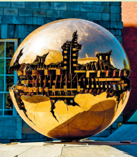
'Sfera con sfera' ('Bol in een bol') 7 van Arnaldo Pomodoro – niet de dode ster van Star Wars.

In het Trinity College bevindt zich de kleinste begraafplaats van Dublin, Chaloner's Corner 11, voor een handjevol verdienstelijke academici, die zich niet van hun alma mater konden scheiden.