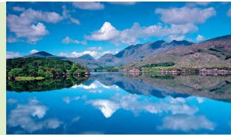
De Lakes of Killarney met wolken-Matterhorn.

Nu komt het aan op je onderhandelingstalent – de standaardtocht biedt tenslotte elke schipper aan: die voert vanaf Ross Castle over het Lower Lake, dan in zuidelijke richting met een kleine lus over het Upper Lake en het Muckross Lake, terug naar de burcht en het eindpunt. Maar met een beetje handigheid en een passende financiële prikkel is een uitgebreide tocht volgens