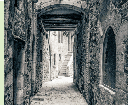
Echt griezelig: decors zoals hier in de Rue de la Liberté zijn geknipt voor historische films.

Eye of the Devil , in 1966 deels in de Dordogne opgenomen, is een ingewikkeld verhaal over mensenoffers. Een bijrol speelt Sharon Tate, later vrouw van Roman Polanski, die haar met de griezelkomedie Fearless Vampire Killers (Met Jouw Tanden in Mijn Nek) beroemd maakte. In 1969 werd Tate slachtoffer van een moordpartij, uitgevoerd door de sekteleider Charles Manson.