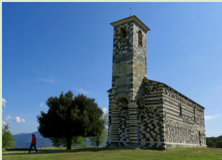
San Michele de Murato.

Het schip van de San Parteo de Mariana 2 dateert uit de 12e eeuw; de apsis uit de 11e. Van de Romeinse tijd tot in de middeleeuwen lag er een begraafplaats rond deze locatie, waar eerder ook al een kerk stond. Boven de smalle deur aan de