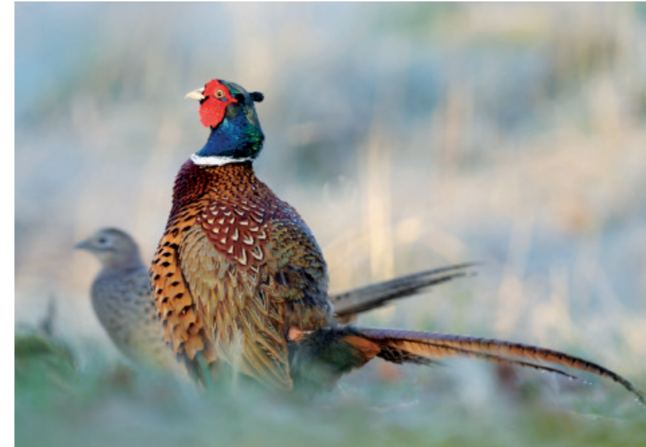
Boven: een fazant.

Op het gebied van toerisme heeft Borlänge pas op het tweede gezicht iets te bieden. De grootste stad in de provincie Dalarna draait in de eerste plaats om industrie en spoorwegen. De metaal- en papierindustrie domineert en Borlänge is ook een spoorwegknooppunt. Buiten de regio ook bij jongeren bekend werd de stad echter vooral door het Peace & Love Festival en de uit Borlänge afkomstige band Mando Diao. Spannend