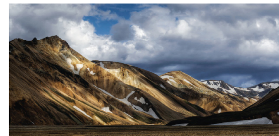
Het dal van Landmannalaugar.