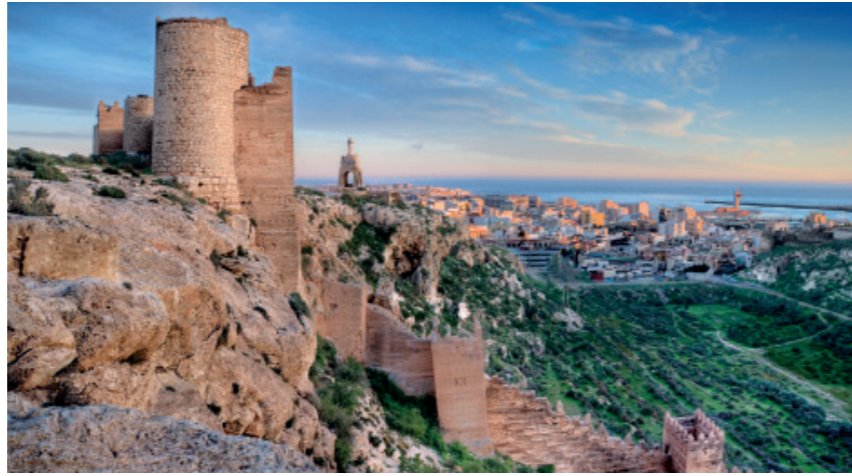
Boven Almería tronen de imposante muren van het Alcazaba.