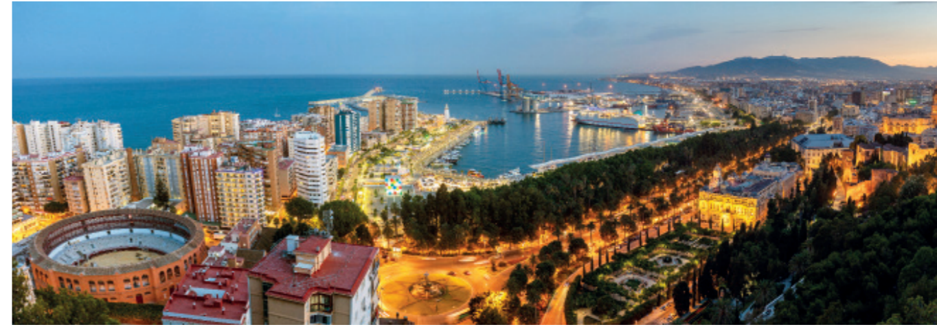
Al zo'n 3000 jaar geleden waardeerden Fenicische zeevaarders en kooplieden de gunstige ligging van Málaga aan de Middellandse Zee.

waartoe ook Córdoba, Murcia, Jaén en delen van Granada behoorden. In 1489 werd de stad heroverd door de christenen, waarna ze een ondergeschikte rol speelde. Tegenwoordig richt Almería zich sterk op de landbouw. In de nabije omgeving staan grote kassen waar groente en fruit voor de export worden geteeld. In het nabijgelegen dal van de Andarax liggen bovendien fruitboomgaarden en wijngaarden. Het grootste deel van Almería bestaat uit moderne wijken met brede, door palmen omzoomde straten. De stad wordt echter nog steeds gedomineerd door de op een heuvel tronende Alcazaba. De bouw begon al in de 10e eeuw en het is nu een van de imposantste en best bewaard gebleven vestingen van Andalusië. Het oude stadsdeel met de pittoreske vissers- en Gitanoswijk La Chanca bij de kasteelheuvel doet nu nog steeds erg Moors aan. De kleurrijke vierkante huizen en de grotwoningen lijken wel overblijfselen uit een ver verleden. Voor de verdere reis is het aan te raden in plaats van de snelweg nabij de kust te kiezen voor de romantische, door het gebergte van de