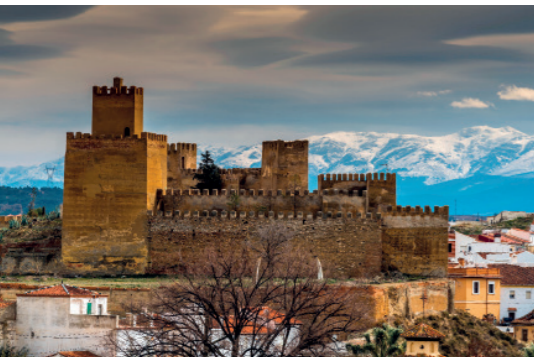
Alcazaba van Guadix.

De Sierra Nevada is een groot en compact bergmassief met vijftien toppen van meer dan 3000 m hoog. Als je vanuit het noorden, vanaf het dal van Granada, naar het gebergte kijkt, zie je aan de horizon een strook afgeronde bergtoppen. Die afvlakking geeft aan dat de ijstijd door erosie haar sporen heeft nagelaten, de meest zuidelijke sporen op het Europese continent. In dit gebergte tref je een weergaloos en spectaculair landschap aan in een U-vorm, met ketelvormige insnijdingen, bergmeertjes, gletsjerpuin op de berghellingen en talloze bergkammen, zoals de Laguna de la Caldera. Dit is een gebied van (nagenoeg) eeuwige sneeuw, waar aan het einde van het voorjaar veel geneeskrachtige bronnen worden gevoed door het smeltwater. Het water uit het gebergte voedt ook een uitgebreid netwerk van riviertjes en kanalen dat in La Alpujarra ligt, en verder de vele rivieren en beken in het oostelijke deel van Andalusië.