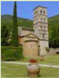
De Abbazia di San Pietro in Valle.