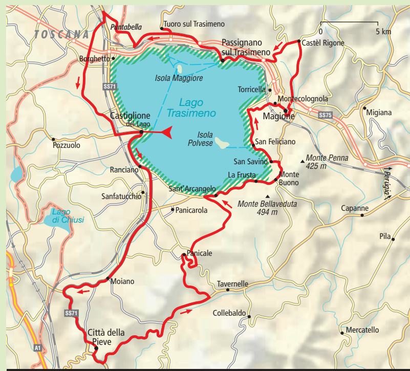
Uitneembare kaart: A/B 4-6

20, San Feliciano, tel. 075 847 92 61, apr.-juni en sept. do.-zo. 10-12.30, 15-18, juli-aug. di.-zo. 10.30-13, 16-19.30 uur, overige maanden beperkte openingstijden, toegang € 3.