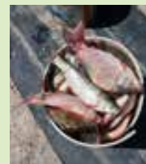
De vangst van de dag.

Voorbij Tuoro, bij Puntabella , waar de weg heel dicht langs het meer loopt, zijn de vergezichten op het Lago Trasimeno op z'n mooist. Het is dan niet ver meer naar Castiglione.