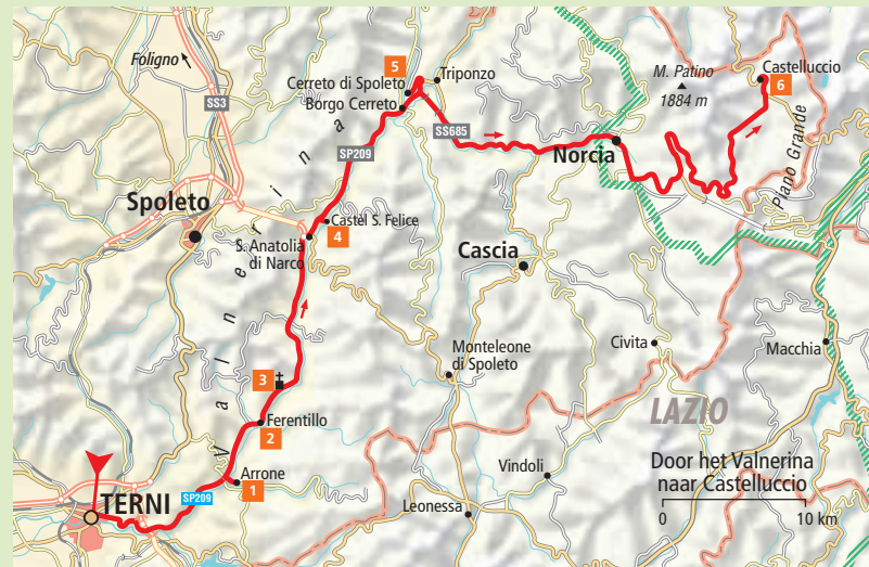
Uitneembare kaart: E 7/8, F 7, G 7

park is gevestigd in Visso (Marche): Piazza del Forno 1, 62039 Visso (MC), tel. 0737 97 27 07, www.sibillini.net . Opmerking: de beste tijd is mei-juni, maar let wel: de sneeuw bij Castelluccio moet al wel weggedooid zijn.