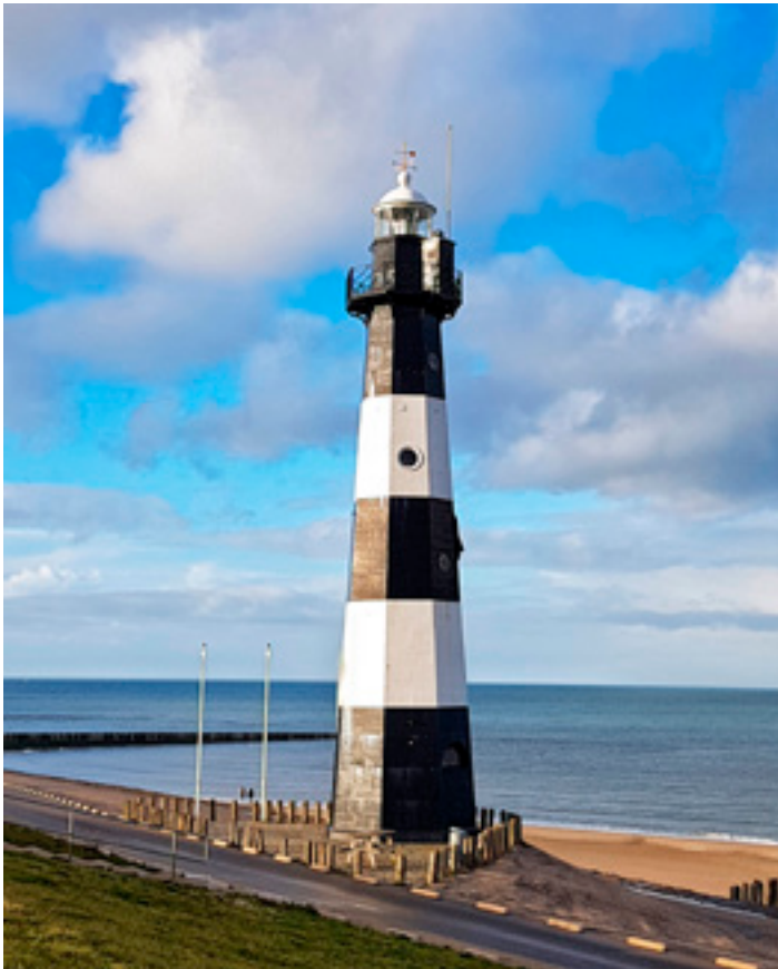
Vuurtoren Nieuwe Sluis