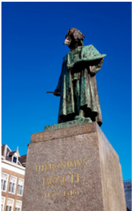
Standbeeld van Jheronimus Bosch

Varken (vreemde straatnamen hebben ze in Den Bosch). Bij de bocht naar rechts, verderop, staat het gemeentelijke stadskantoor met moderne vliesgevel aan je rechterhand. Achter het Wild Varken gaat vanaf hier verder als Wolvenhoek. Na zo'n 75 m bereik je een kruispunt met aan de overzijde het Anne Frankplein.