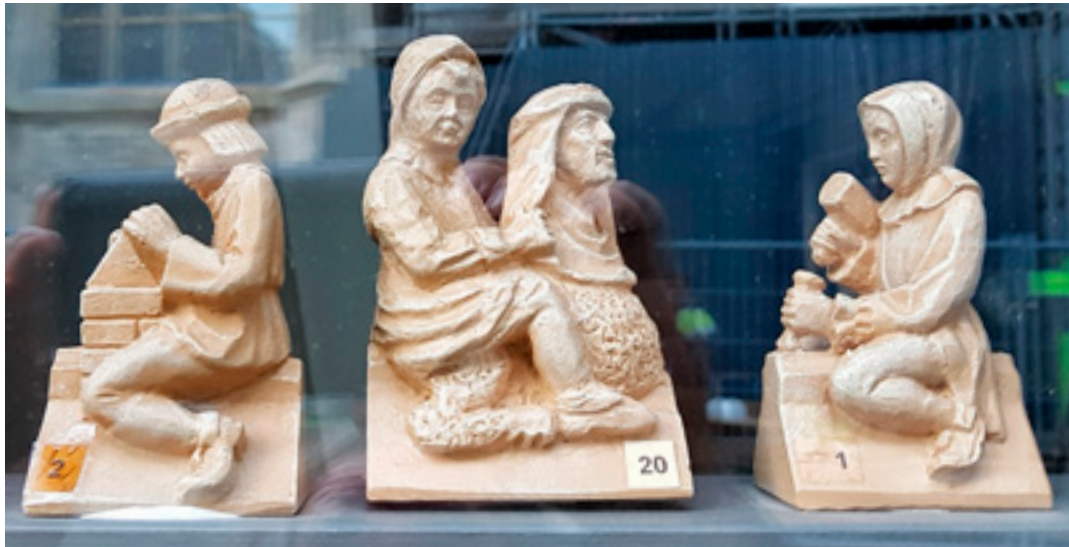
Replica's van beeldjes op de Sint-Jan

De Sint-Janskathedraal aan de noordzijde van het plein is het pronkstuk van de stad ( www.sint-jan.nl ). Officieel heet deze grootste kathedraal van Nederland de 'Kathedrale Basiliek van Sint Jan Evangelist', maar men noemt 'm gewoon de Sint Jan. De kerk behoort tot de Top 100 van de Rijksdienst voor de Monumentenzorg en geldt als zogenaamd 'kanjermonument' (je hoort het Erica Terpstra zeggen).