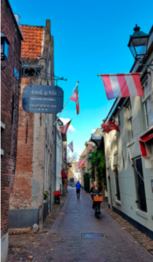
Blik in de Molenstraat