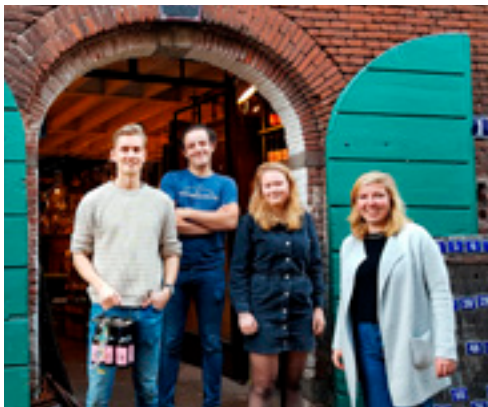
Bij de brouwerij