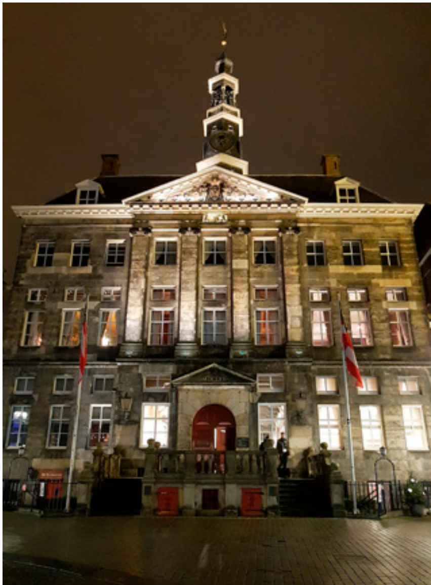
Het oude stadhuis op de Markt

hoek en het Anne Frankplein gaat de route naar links, de Waterstraat in. Sla aan het einde rechtsaf, de Verwersstraat in. Na minder dan 30 m is aan je rechterhand het plein voor de hoofdingang van het Noordbrabants Museum.