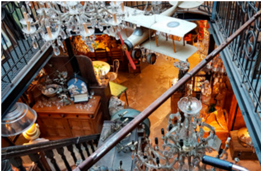
Antiek en curiosa in La Folie

Ga schuin tegenover de antiekwinkel met brouwerij links het Uilenburgstraatje in. Sla aan het einde rechtsaf en loop de Postelstraat in. Na iets minder dan 100 m loop je links de Stooftstraat in. Sla aan het einde rechtsaf naar de Snellestraat, een deel van het voetgangersgebied in de binnenstad. Steek 30 m verderop dwarsstraat de Schapenmarkt over en vervolg je wandeling door het voetgangersgebied over de straat Achter het Vergulde Harnas, die na zo'n 40 m overgaat in Achter het Wild