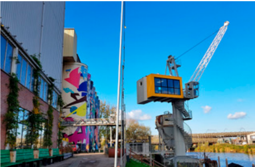
De Bossche Kraan, met unieke suite erin.

Mengfabriek werd rond 1909 gebouwd en is een rijksmonument. Hier begon ooit een meelfabriek die na de oorlog van locatie ruilde met een mengvoederfabriek uit Rotterdam. In 1983 kwam de fabriek in bezit van De Heus Voeders, de eigenaar die in 2014 dus de lichten uitdeed. Onder regie van de gemeente Den Bosch is het complex vervolgens nieuw