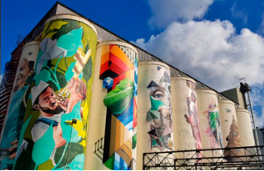
De oude mengvoedersilo's

te staan. De fabriek kreeg in 2004 een nieuwe bestemming als theatercomplex en telt nu twee theaterzalen, vijf filmzalen, een café-restaurant en repetitieruimten.