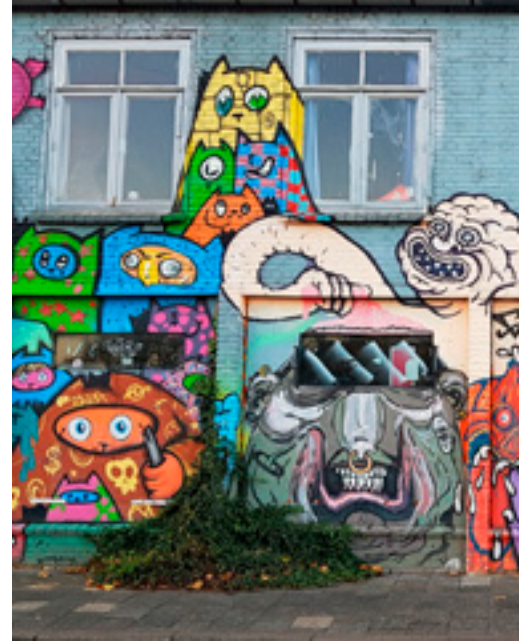
Kraakpanden langs de Havenkade

leven ingeblazen. In de Mengfabriek zit bijvoorbeeld een heel scala aan bedrijfjes en hippe horeca. In de gebouwen rechts ervan huizen onder meer een boksschool, een skate center en een breakdance en hiphop dansschool. Het Werkwarenhuis links daarvan is het creatieve centrum van het terrein en in de 2800 m 2 grote Kaaihallen nog verder naar links, vinden evenementen plaats ( www.mengfabriek.nl ).