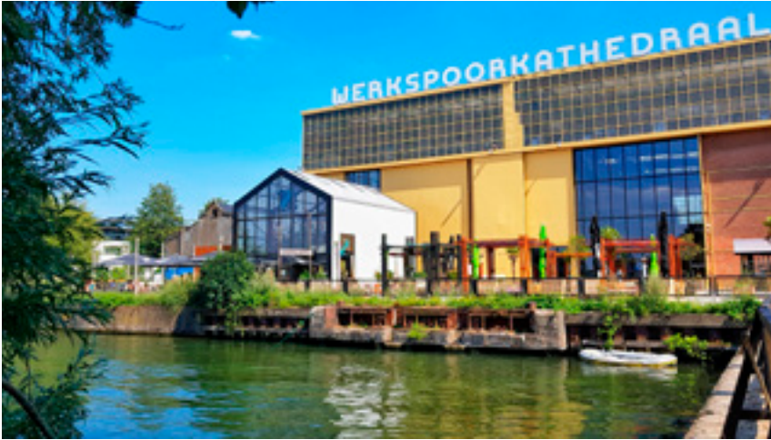
Werkspoorkathedraal en proeflokaal De Leckere