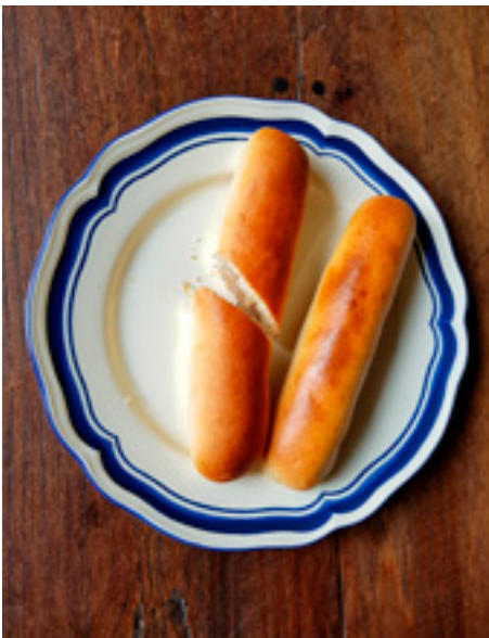
Twee Brabantse worstenbroodjes

1749 en 1935 een militair exercitie- en paraderrein was. Het is ook de geboorteplaats van het reizende theaterfestival De Parade. Het festival doet iedere zomer vier grote steden aan, op het Bossche plein heeft men inmiddels in augustus een eigen festival, het Theaterfestival Boulevard.