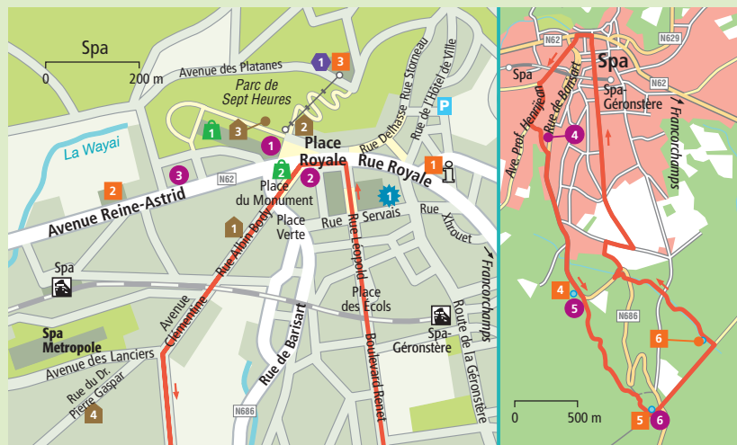
Uitneembare kaart: G 2

Reine-Astrid 77b, mrt.-begin nov. dag. 14-18 uur, € 4. Les Thermes de Spa 3 1 : Colline d'Annette et Lubin, 9-20/22 uur, 3 uur € 22, dag € 33. Funiculaire € 2.