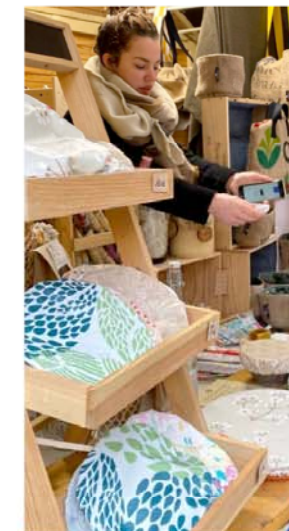
Marché de Noël Durable 2019

Elke eerste zondag van de maand (mrt.-juni en sept.-nov.) is het Open Roubaix : juist dan zijn ateliers en galerijen geopend voor street art : La Condition Publique , Ateliers Jouret , de ateliers van RemyCo en Non-Lieu . Ook de Maisons de Mode van Roubaix zijn dan open en museum La Piscine geeft gratis toegang. En reken maar dat Roubaix juist dan heel veel creativiteit binnen de thema's zero waste ( Zéro Déchet ), innovatie en duurzaamheid laat zien. Hier is zondag dus zeker geen verveeldag.