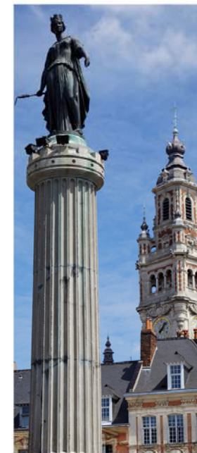
Colonne de la Déesse, met op de achtergrond het oude belfort

Het complex bestaat uit 24 identieke, aaneengeregen huisjes, op kosten van 24 kooplieden gebouwd. Ze liggen in een vierkant om een binnenhof, waarbij de benedenverdiepingen uit arcades bestaan. Vier poorten, waarop Vlaamse leeuwen getuigen van de zeer vroege geschiedenis, vormen de toegang.