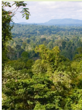
Uitzicht vanaf Misty Mountain.

Van de Surinaamse jungleresorts ligt er één bij uitstek ver buiten de bewoonde wereld: Kabalebo, in West-Suriname. Binnen een straal van 100 km zijn er geen dorpen. Puur natuur dus, een ideale plek om te ontspannen.