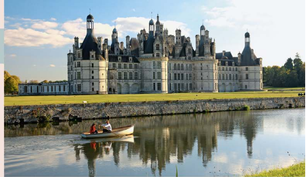
Fraai uitzicht op de noordgevel van het kasteel van Chambord

► Dit symbool verwijst naar de uitneembare kaart