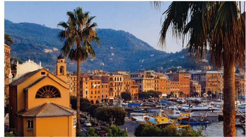
Een van de mondainste plaatsen aan de Italiaanse Riviera: Santa Margherita Ligure