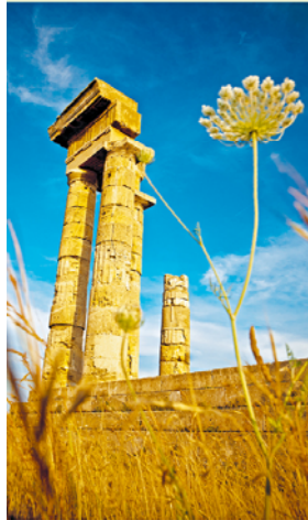
Van de tempel van Apollo is maar weinig overgebleven.

Loop via de Pindou de heuvel met de akropolis op. Aan de andere kant van de Isiodou loopt een platgetreden pad langs de fundamenteën van een stoa 28, een zuilengang die als ingang van het tempel terrein diende. Let op: vergeet hier niet achterom te kijken voor een fantastisch uitzicht op de haven!