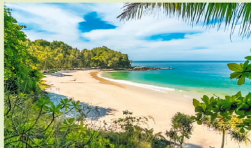
Zie je jezelf hier al liggen?

Voor de meeste bezoekers begint de dag tegen 8 uur 's ochtends bij de steiger 1 van Patong . Ondanks de mooie geplastificeerde foto's die de schippers omhooghouden zien veel toeristen een