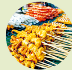
Typisch Thais: worstjes, visballetjes of andere snacks op een spiesje zijn populaire tussendoortjes – of het nu ochtend, middag of avond is.

Het hart van de markt wordt gevormd door de eettentjes. Het stoomt, het spettert, het sist. Overall wordt gekookt, gebakken, ingepakt, verkocht, gegeten en geschraapt. Kleine standjes bieden allerlei bekende en minder bekende gerechtjes om mee te nemen of ter plekke te verorberen. Ga voor de grotere trek naar de gaarkeukenachtige kramen met zitruimte en een menukaart (soms in het Engels, maar meestal met plaatjes). Kies je vis of schaaldier zelf uit en laat alles voor je ogen bereiden.