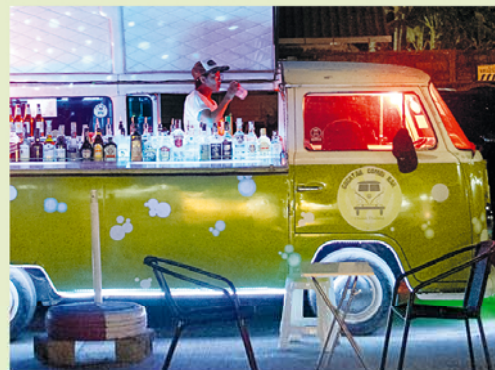
Zin in een borrel? De lichtgevende Volks-wagenbus voor de markthallen is zowel blikvanger als cocktailbar.

Laat je niet afleiden door het grote aanbod 'toeristenmeuk', maar onderzoek vooral de verborgen hoekjes. Vreemd uitgedoste mensen wachten in hun kleine winkeltjes op klandizie. Sommige zitten van top tot teen onder de tatoeages, andere dragen zelfgemaakte lederen cowboykleden. Hun zaakjes zijn niet minder bijzonder, bijvoorbeeld de kraampjes met amuletten. Sommige voorwerpen doen wat vreemd aan – zou jij