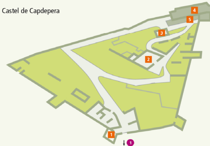
Castel de Capdepera

Uitneembare kaart: K 3 | Parkeren: bordjes verwijzen naar de parkeerplaats nabij de Plaça de l'Orient