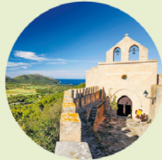
Gedurfd: de klokken van de kapel steken uit buiten de ringmuur.

Zo hoort een middeleeuwse burcht eruit te zien. Massieve muren met kantelen, een weergang voor de soldaten, een burchtkapel met klokkentoren en fantastische uitzichten tekenen het Castell de Capdepera , de grootste vesting van Mallorca.