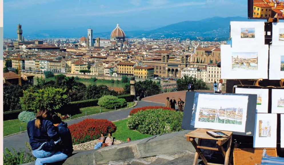
Florence, de bakermat van de renaissance

► Dit symbool verwijst naar de uitneembare kaart